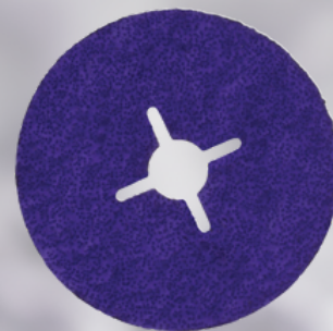
3M™ Cubitron™ 3 Fibrový disk 1182C