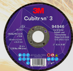
3M™ Cubitron™ 3 Brusnořezný kotouč