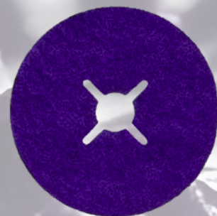
3M™ Cubitron™ 3 Fibrový disk 1187C vysokozátěžový