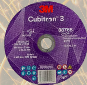
3M™ Cubitron™ 3 Řezný kotouč