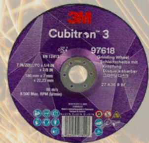
3M™ Cubitron™ 3 Brusný kotouč