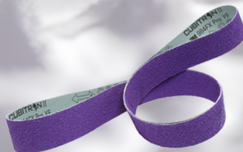
3M™ Cubitron™ 3 Brusný pás 1184F